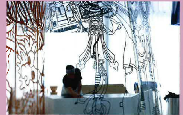
Hosoya Schäfer Architects: AnAn