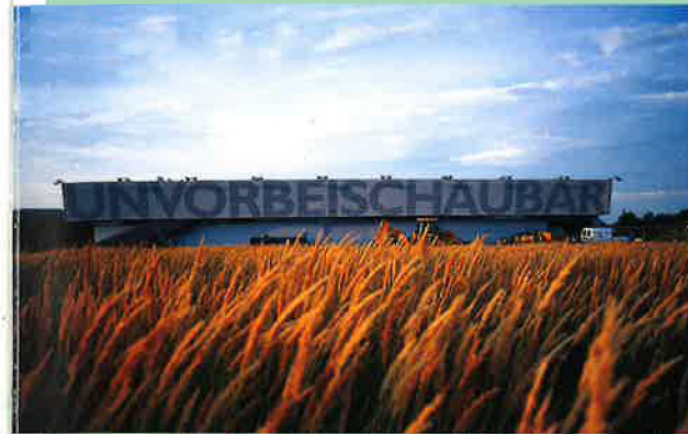
Jens Messdat: Trevison (Quarkraft Architekten, Foto: Harta Burnaus)