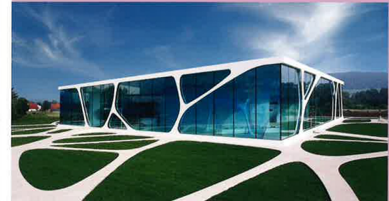
Griluxe: Leonardo Glass Cube

Sollten trotz sorgfältiger Nachforschungen einzelne Rechteinhaber nicht ermittelt worden sein, bitten wir diese, sich ggf. an den Veranstalter zu wenden.