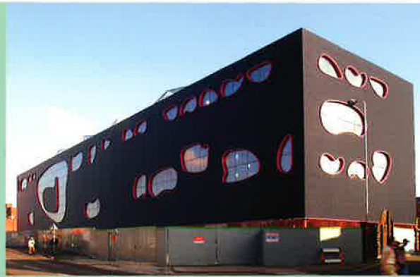
William Alsop: The Public