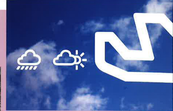
Ruedi Baur: Köln-Bonn Airport