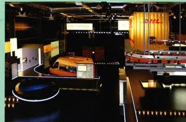
Tried: DHL Innovation Center