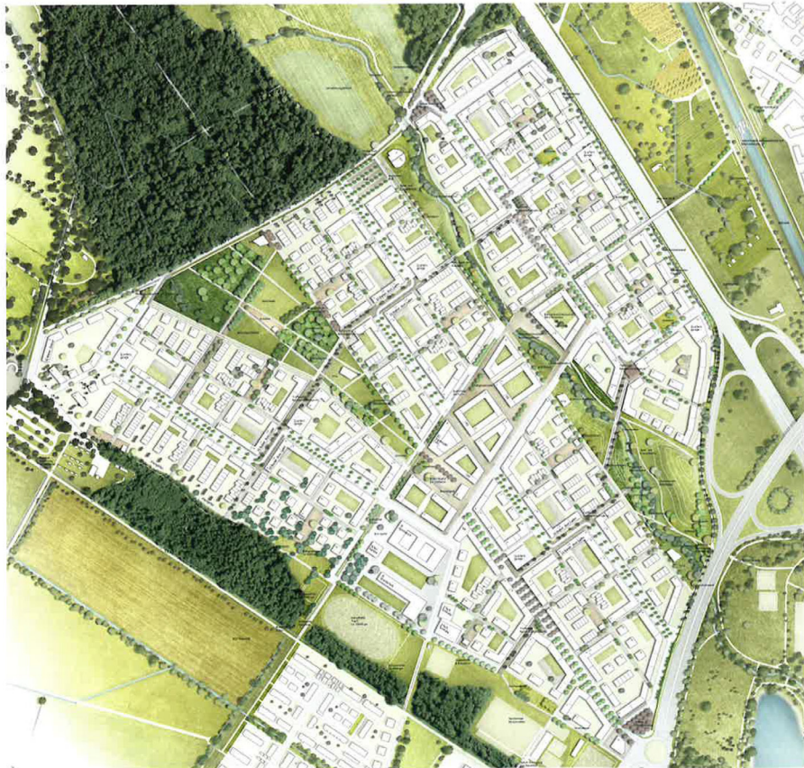
Lageplan M. 1:9.000