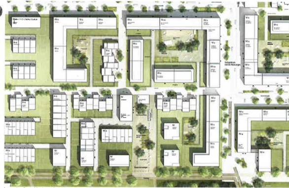
Lageplan Superblock M. 1:3.000