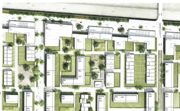
Lageplan Handlage M. 1:3.000