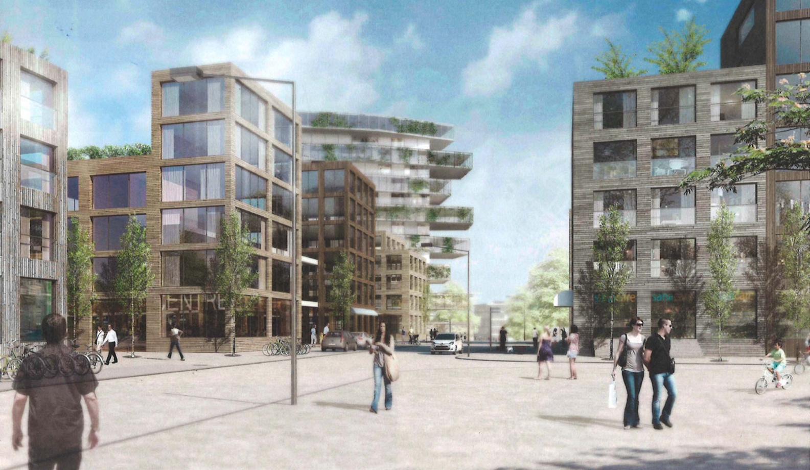
Abwandlung, Anpassung und Verbesserung des Blockrands aus dem 19. Jahrhundert? Visualisierung Siegerprojekt: bauzeit architekten