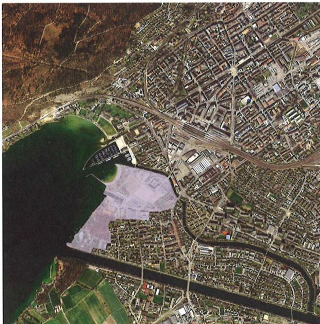
Der neue Stadtteil entsteht direkt am See.

Dichtes Quartier mit Kanälen • Der Perimeter des Wettbewerbs umfasst 312 300 m 2 und spannt sich zwischen den Strandbädern von Biel und Nidau und dem Schloss Nidau auf. Im Wettbewerbsgebiet könnten rund 130 000 m 2 Geschossfläche für Wohnen, Dienstleistung und Gastronomie erstellt werden. Mit Agglolac soll die Bieler Seebucht ein weiteres attraktives Element erhalten. Für die Bevölkerung soll eine attraktive, zusammenhängende Uferpromenade mit verbesserter Zugänglichkeit zum See entstehen. Diese soll den vielfältigen Bedürfnissen nach unterschiedlichen Erholungsräumen in der Bucht Rechnung tragen. Ein dicht bebautes, von einem oder mehreren Kanälen durchzogenes städtisches Quartier soll unterschiedliche Nutzungen ermöglichen. Die Finanzierung der öffentlichen Infrastruktur soll durch den Verkauf von Land erfolgen. Aus dem Jurybericht