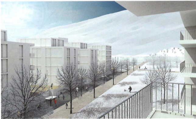
Schlosskanal im Winter