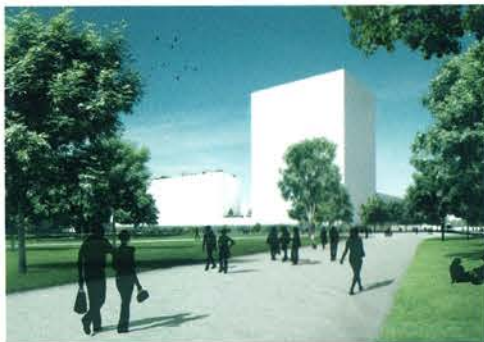
POGLED S ŠMARTINSKEGA PARKA