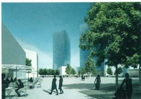
POGLED S TRGA KOLINSKA