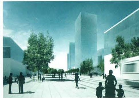
TRG BTC S PARKOM V OZADJU