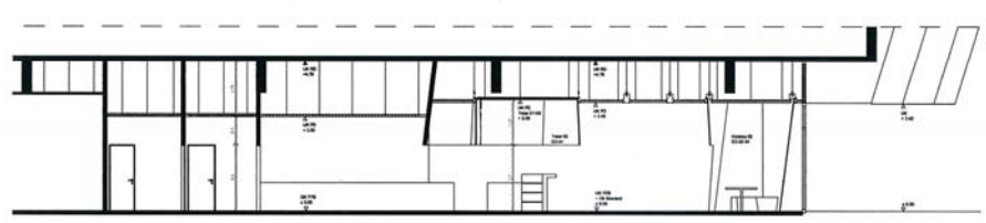
Plan du restaurant et coupe transversale.

MAÎTRISE D'OUVRAGE : Autostadt GmbH. MAÎTRISE D'ŒUVRE : Hosoya Schaefer Architects.